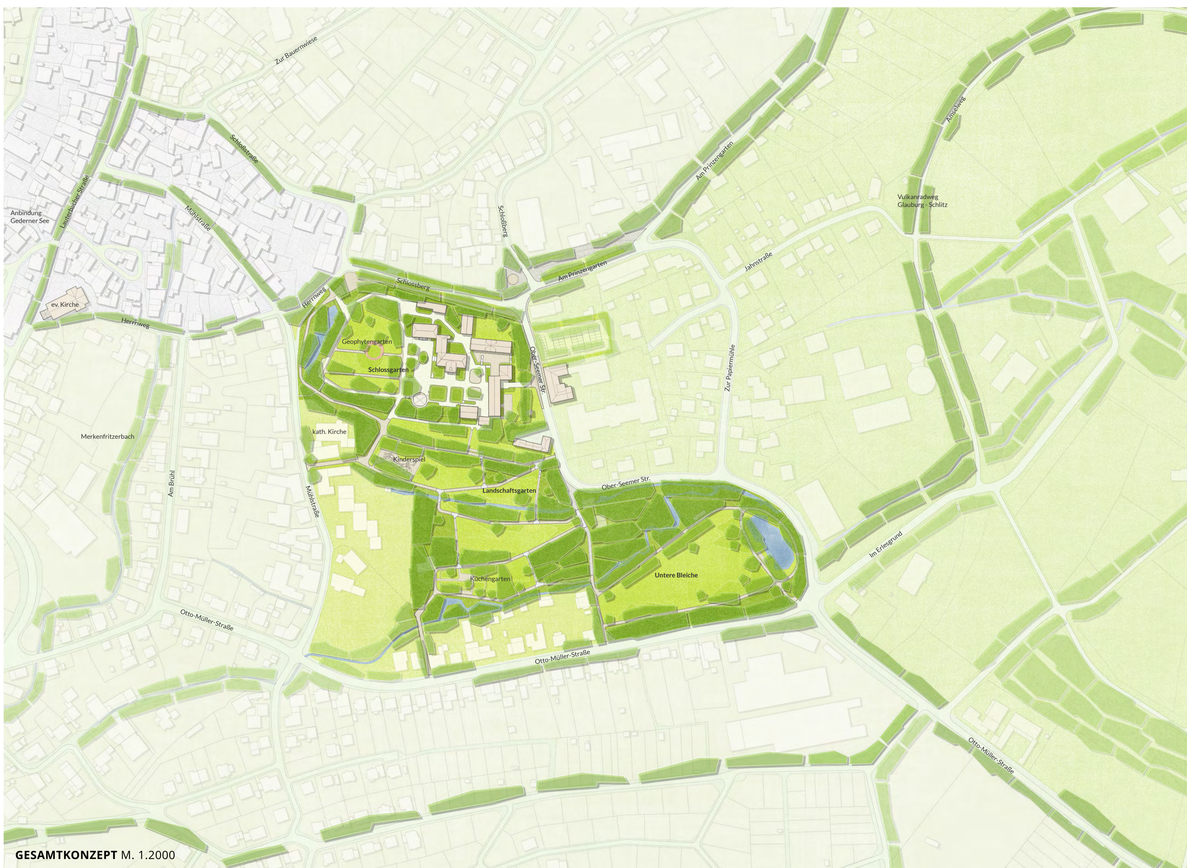
GESAMTKONZEPT M. 1:2000