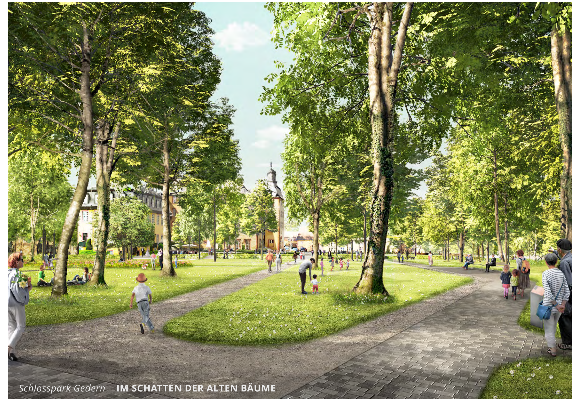
Schlosspark Gedern IM SCHATTEN DER ALTEN BÄUME

Es wird ein neues für verschiedene Altersgruppen reizvolles Spiel- und Aufenthaltsangebot im Park vorgesehen. Terrassen am Weg laden ein zum Ausblicken, auf der Fläche des ehem. Tennplatzes laden der Küchengarten sowie das Grüne Klassenzimmer ein, eine naturnahe Ufer- und Bachlaufgestaltung wird am Mühlgraben vorgesehen. Im Lustgarten lockt das üppig blühende Geophytenrondell. Der bestehende Schlossplatz auf der oberen Bleiche wird geordnet und ergänzt.