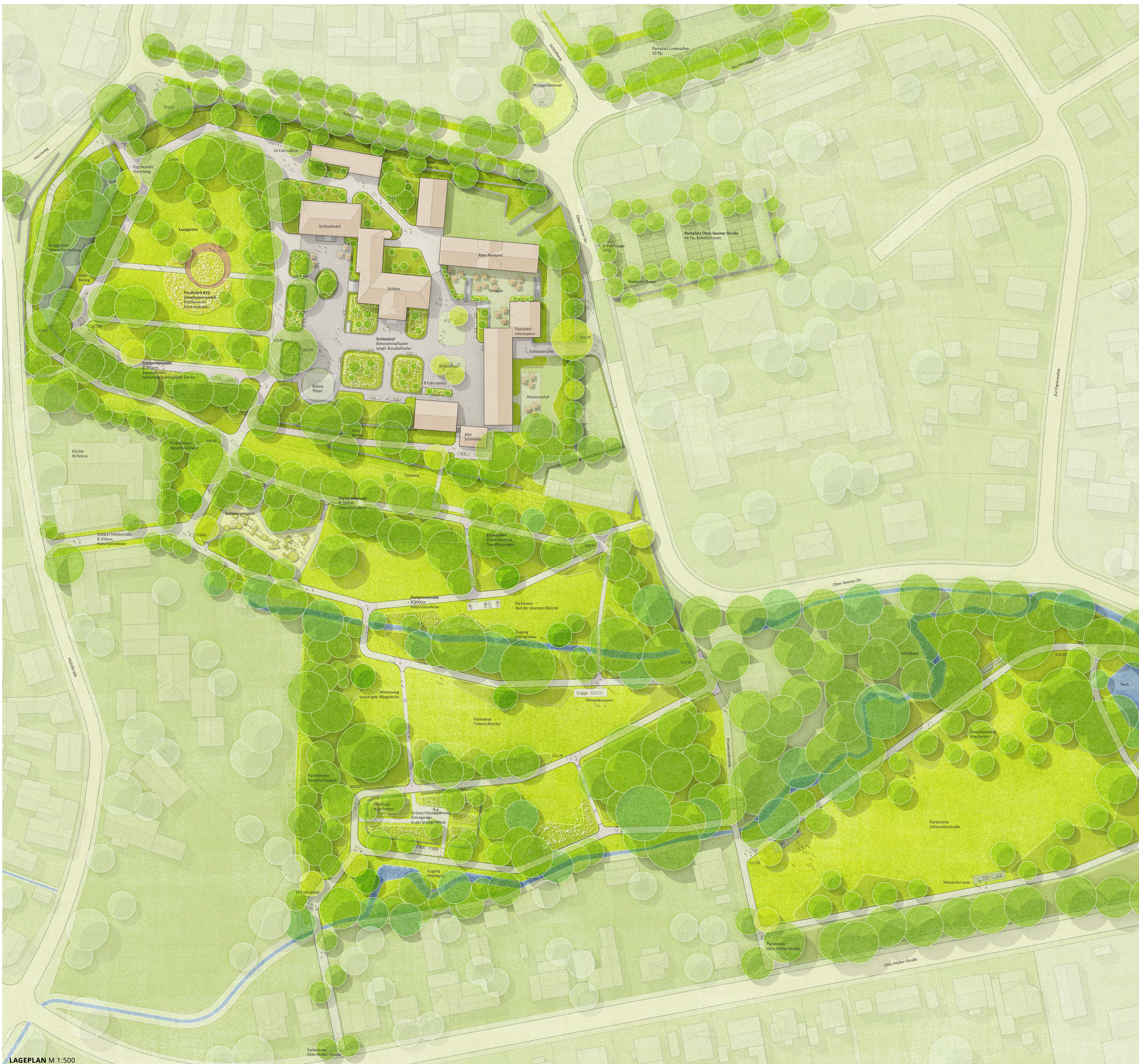
LAGEPLAN M 1:500